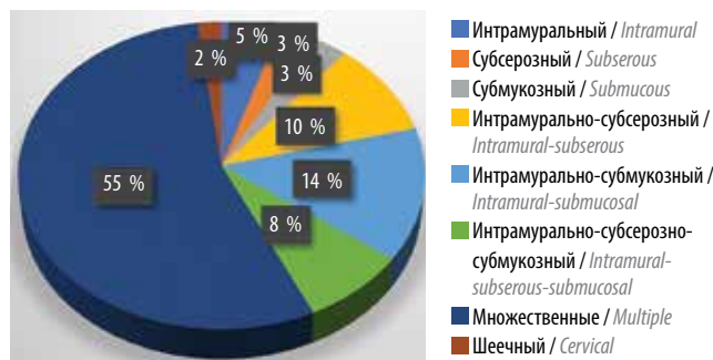
Рис. 1. Локализация миоматозных узлов Fig. 1. Localization of myomatous nodes

При оценке менструального цикла у пациенток после ЭМА регулярный менструальный цикл наблюдался у 80 % женщин, у 18 % отмечен нерегулярный менструальный цикл, который восстановился в течение 12 мес после операции, у 2 % наступила менопауза.