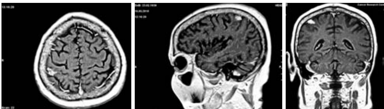
Рис. 2. МРТ головного мозга от 22.06.2010 г. (после 4-го курса ХТ)