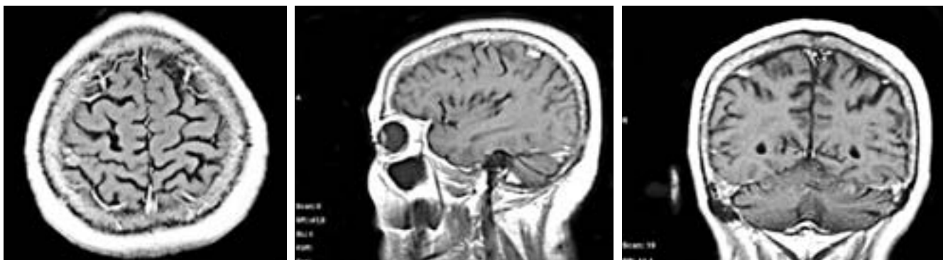
Рис. 3. МРТ головного мозга от 14.07.2010 г. (после 6-го курса ХТ)