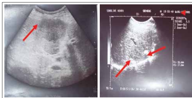
Рис. 3. Состояние печени: а – до лечения – наличие метастазов (указаны стрелкой); б – после проведения 6 курсов ХТ – очаги фиброза на месте метастазов (указаны стрелками)

При контрольном рентгенологическом исследовании наличия метастазов в легких не выявлено, корни и средостение не расширены, синусы свободны (см. рис. 1б).